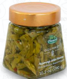
ASPARAGI DELLA NONNA VSASNO290