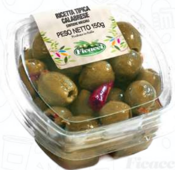
RICETTE TIPICA CALABRESE TARTIDECA150