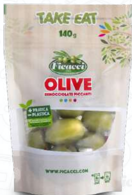
OLIVE DENOCCIOLATE PICCANTI DPDENPE140