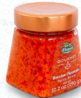
BOMBA PICCANTE VSBOP1290