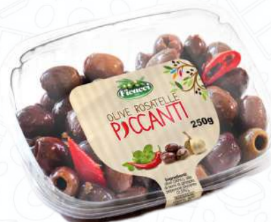
OLIVE ROSATELLE PICCANTI TAROPI250