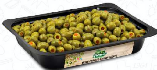
OLIVE FARCITE AL PEPERONE FRFAROM15