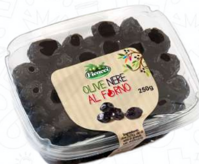
OLIVE NERE AL FORNO TASECO250