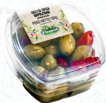
RICETTA TIPICA NAPOLETANA TARTIETNEA150