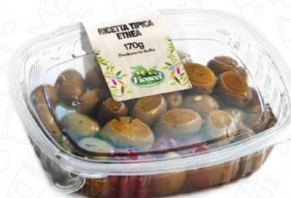
RICETTA TIPICA ETNEA GGETNEA170