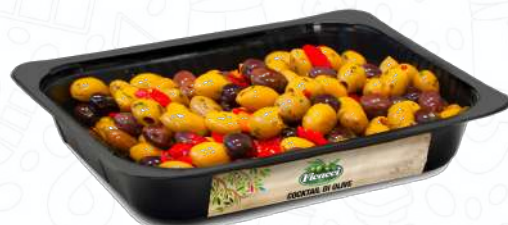
COCKTAIL DI OLIVE FRCOCKTAIL13