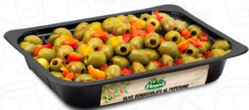
OLIVE DENOCCIOLATE AL PEPERONE FRDENPE1