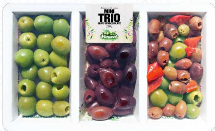
MINI TRIO OLIVE DENOCCIOLATE 210g- #MOTRIP213

Soddisfa le esigenze dei clienti offrendo tre diverse varietà di olive in un'unica confezione . Imballaggio innovativo e sostenibile composto dall' 87% di carta , design accattivante, elegante sulla tavola, dimensioni compatte ( 210g ). Articolo a rapida rotazione, amato dai buongustai, comodo e pronto all'uso, senza conservanti, non pastorizzato, fresco .