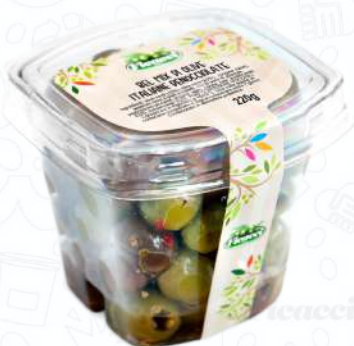
BEL MIX DI OLIVE ITALIANE DENOCCIOLATE OFDENDOLE220