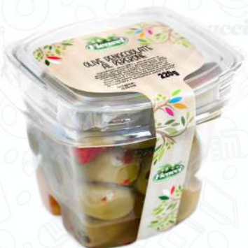
OLIVE DENOCCIOLATE AL PEPERONE OFDENPE220