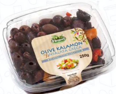
OLIVE KALAMON TAKALDE250