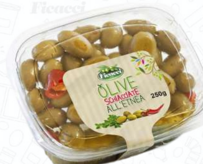
OLIVE SCHIACCIATE ALL'ETNEA TAGRESCA250