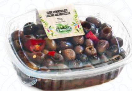
OLIVE DENOCCIOLATE LECCINO ALL'ABRUZZESE GGDELE170