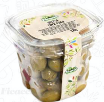
RICETTA TIPICA ETNEA OFETNEA220