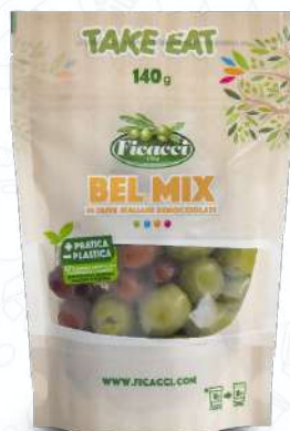
BEL MIX DI OLIVE DENOCCIOLATE DPDENDOLE140