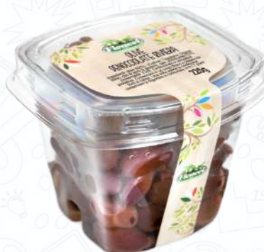
OLIVE DENOCCIOLATE RIVIERA OFDETA220