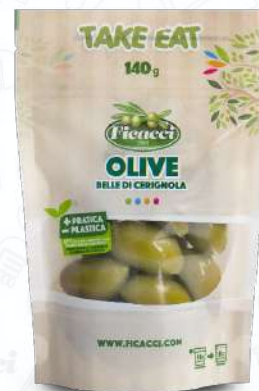
OLIVE BELLE DI CERIGNOLA DPVERCE140