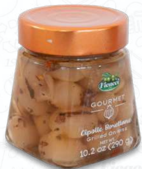
CIPOLLE BORETTANE VSCIBO290