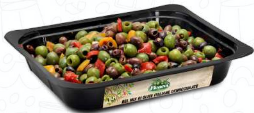
BEL MIX DI OLIVE ITALIANE DENOCCIOLATE MIXDENDOLE1