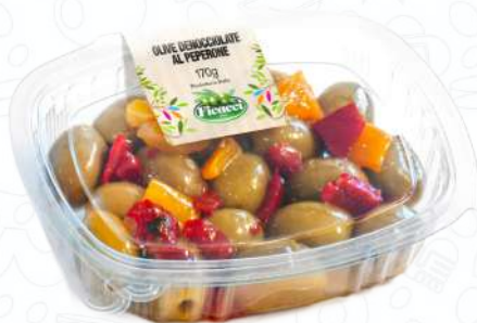
OLIVE DENOCCIOLATE AL PEPERONE GGDENPE170