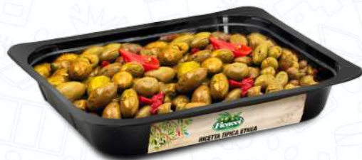
RICETTA TIPICA ETNEA FRITIETNEA15