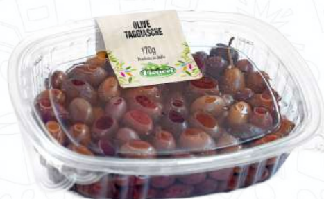
OLIVE TAGGIASCHE GGTAO170