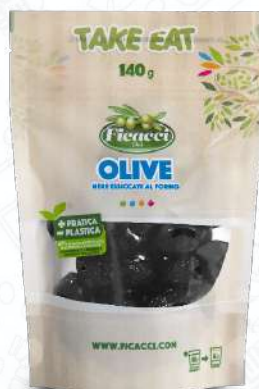
OLIVE NERE ESSICcate AL FORNO DPSECO140