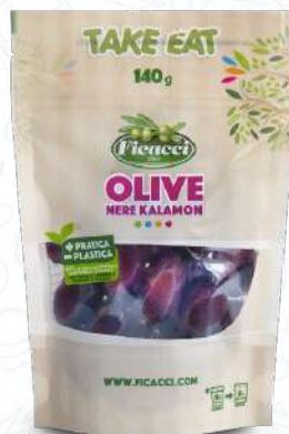
OLIVE NERE KALAMON DPKALI140