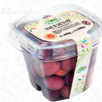
OLIVE DI GAETA DOP OFGASA225