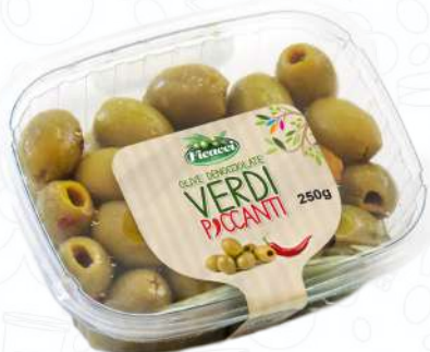
OLIVE DENOCCIOLATE VERDI AL PEPERONE TADENPE250