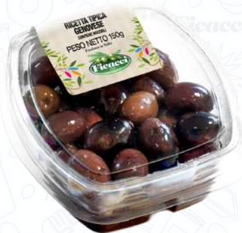
RICETTA TIPICA GENOVESE TARTILEGE150