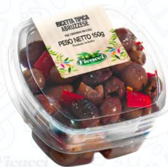
RICETTA TIPICA ABRUZZESE TARTIDELE150