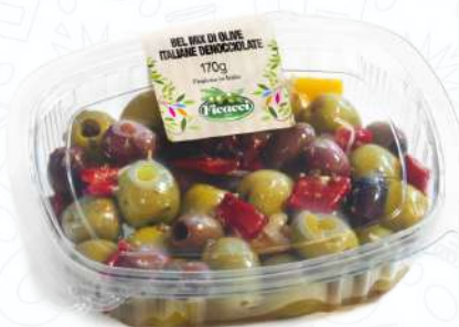
BEL MIX DI OLIVE ITALIANE DENOCCIOLATE GGMIXDENDOLE170