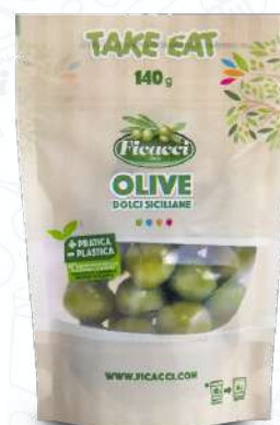
OLIVE DOLCI SICILIANE DPDOLS140