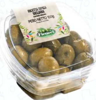
RICETTA TIPICA SICILIANA TARTINOBE150