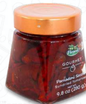
POMODORI SECCHI VSPOSE280