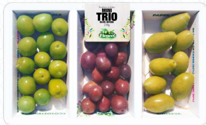
MINI TRIO OLIVE INTERE 210g - #MOTRIU213