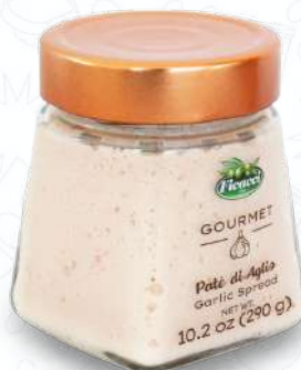
PATÈ DI AGLIO VSPAGLIO290